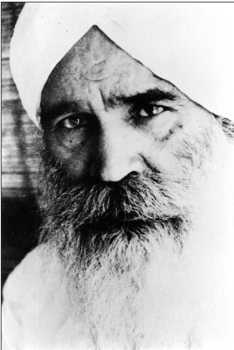
Kirpal Singh (1894-1974)