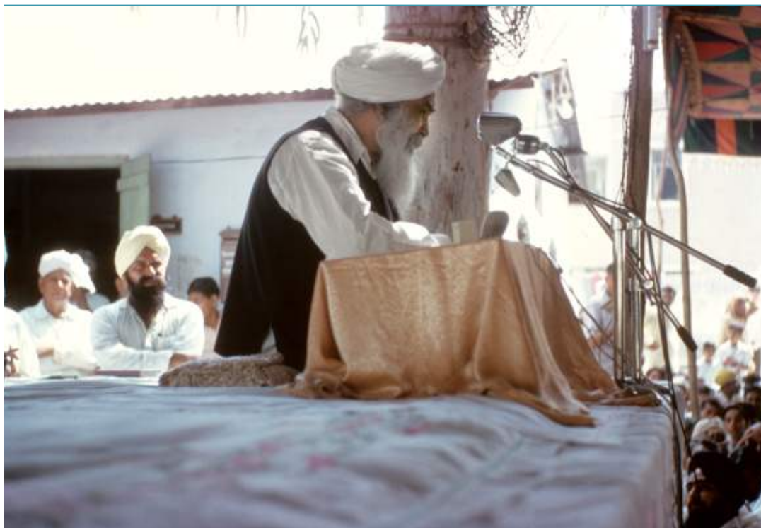
Sant Kirpal Singh Ji