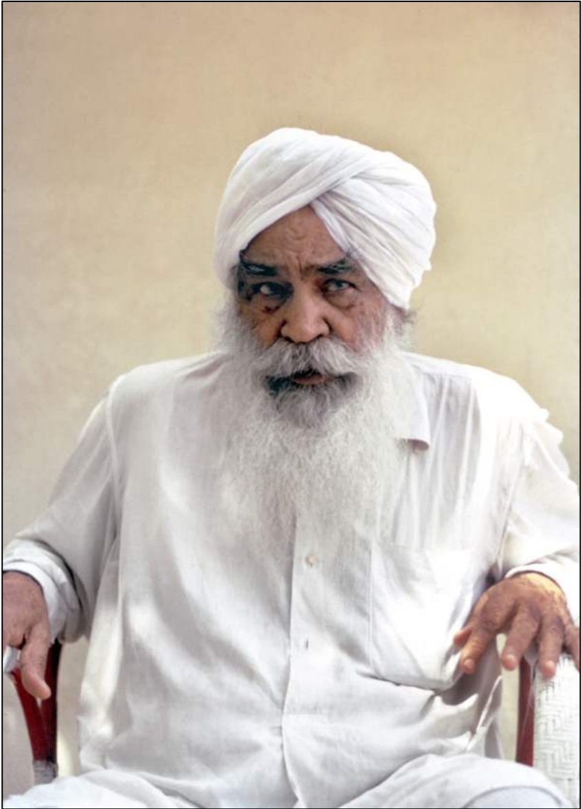
Kirpal Singh 1894-1974